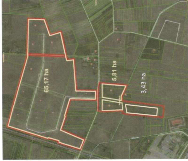
Nendrinieškių k., Skriaudučio k., Steponiškių k. teritorija