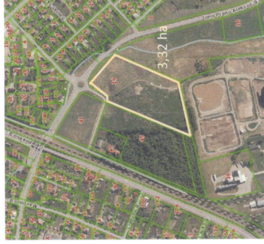
Jono Prano Aleksos g. 16, Marijampolė